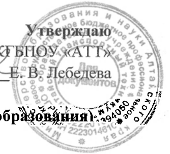
ГРАФИК ПРОВЕДЕНИЯ ГОСУДАРСТВЕННОЙ ИТОГОВОЙ АТТЕСТАЦИИ (III курс, на базе основного общего образования)